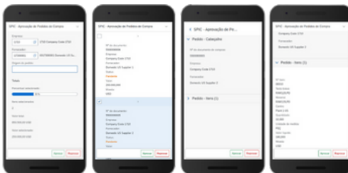
Figura 3 – tela de aprovação do pedido de compra

As telas de aprovação intuitivas exibem um resumo dos dados relevantes, para uma tomada de decisão mais eficiente, rápida e bem-informada, com o clique de um botão.